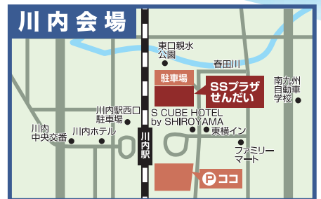
駐車場有:川内駅平佐口(東口)駐車場Dパーキング